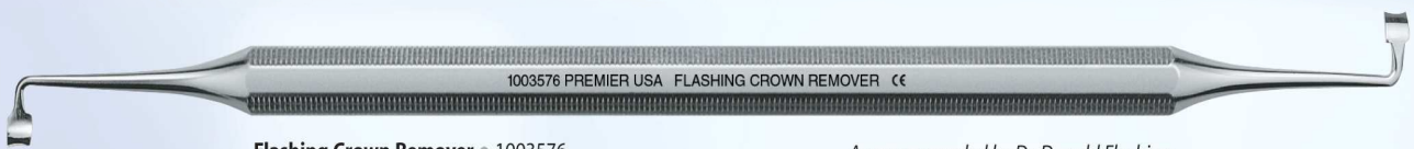
Flashing Crown Remover • 1003576